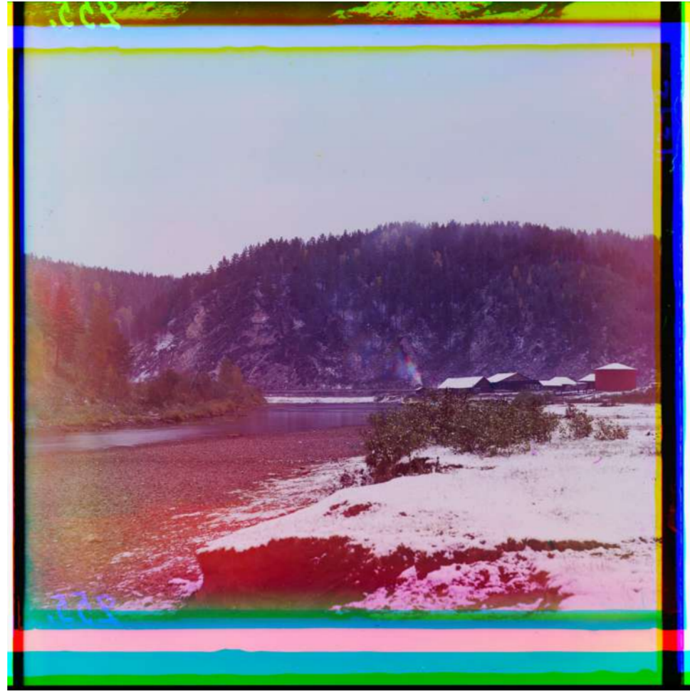
SERGEY PROKUDIN-GORSKY ( Vladímir, Rússia,1863 - París, França,1944 )

Serguei Mijailovitch Prokudin-Gorski va ser un químic i fotògraf rus, deixeble de Dmitri Mendeléiev, que va dedicar la seva carrera a l'avenç de la fotografia i el cinema. Va néixer a Fúnikova Gorá, a la Governació de Vladímir el 1863. Va estudiar amb famosos científics a Sant Petersburg, Berlín i París, on va desenvolupar les tècniques necessàries per a les primeres fotografies en color. El 1900, la Societat Tècnica Russa va presentar les seves fotografies en blanc i negre a l'Exposició Universal de París.