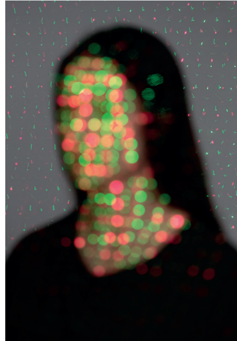
MARIA MAVROPOULOU ( Atenes, Grècia, 1989 )

L'artista Maria Mavropoulou tracta el món intrigant de la intersecció entre tecnologia i humanitat que recorre el nostre present. Al llarg de la seva curta però prolífica carrera, ha transcendit les fronteres convencionals de l'art per capturar l'essència de la intimitat en presència de la tecnologia. La seva fotografia està imbuïda de vibracions modernes i d'un compromís profund amb les emocions humanes en el món digital. Amb una sòlida formació a Belles Arts, ha forjat una carrera única que fusiona creativitat i tecnologia d'avantguarda: realitat virtual, captures de pantalla, generació d'imatges per GAN o intel·ligència artificial, per reflexionar sobre les formes de producció d'imatges actualment. Fa servir la fotografia com a mitjà principal, però la seva feina s'expandeix més enllà de les fotos convencionals.